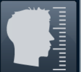
Biometría de Rostro