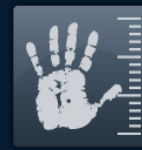
Biometría de Mano