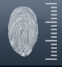
Biometría de Huella