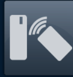
Tecnología de Proximidad